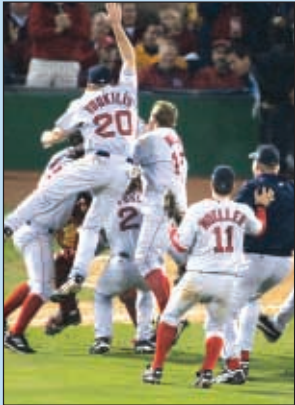
Los Medias Rojas ganan la Serie Mundial. Ver Pág. 1-B