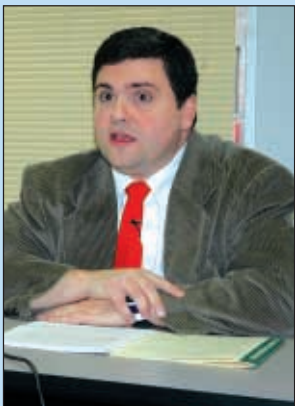
Los inmigrantes desplazan a trabajadores estadounidenses. Ver Pág. 9-A