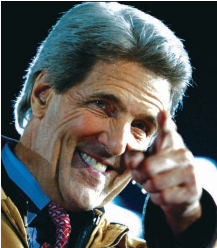
Los dos campañas electorales han utilizado todos sus recursos para conseguir el apoyo hispano. Ambos candidatos han hecho gestos de acercamiento que han ido desde hablar unas cuantas frases en español, hasta ofrecerle a esta comunidad representarios bien en sus gobiernos.