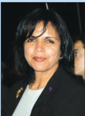
Latinas le dicen "no" a la violencia doméstica. Ver Pág. 2-A