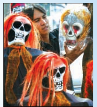
Con la llegada de Halloween, las máscaras y disfraces entran en su temporada de alta demanda.

"Los conductores deben ser especialmente cuidadosos en esta época donde la luz diurna du-